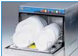
K 210 cesto 14 piatti K 210 basket 14 dishes