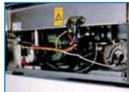
K 210 resistenza frontale inferiore K 210 frontal heating elements