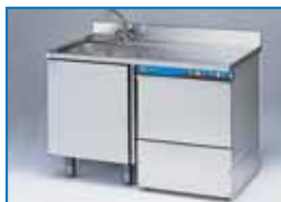
OPTIONAL MLV 120