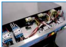
K 600 pannello comandi K 600 control panel