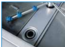
OPTIONAL filtro vasca integrale OPTIONAL integral tank filter