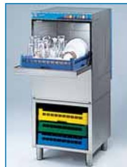
Optional SPI50 dim. 59,5x59x60h cm