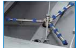
DOTAZ. STANDARD filtro vasca integrale