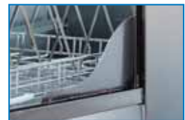
DOTAZ. STANDARD integral tank filter