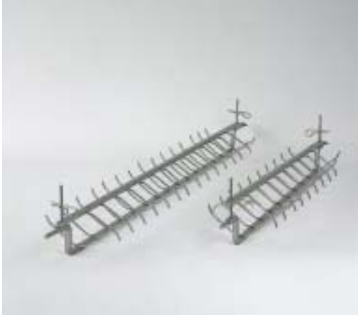
BROCHE POUR ROTIS