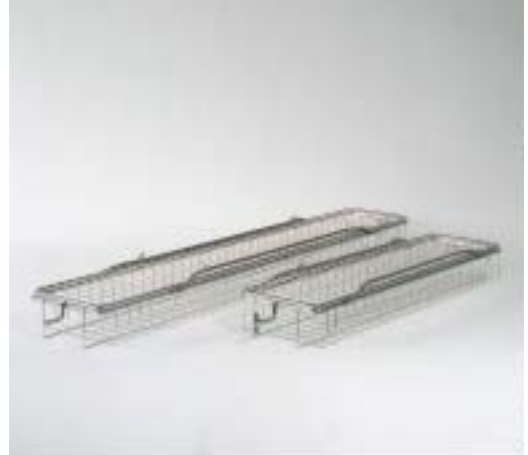
BALANCE SPECIALE FERMEE