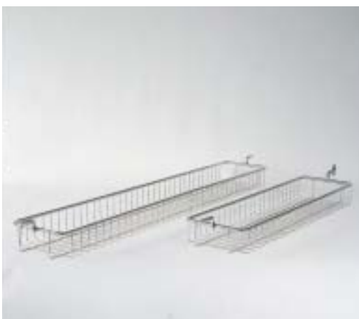
BALANCE (seulement pour les modèles planétaires)