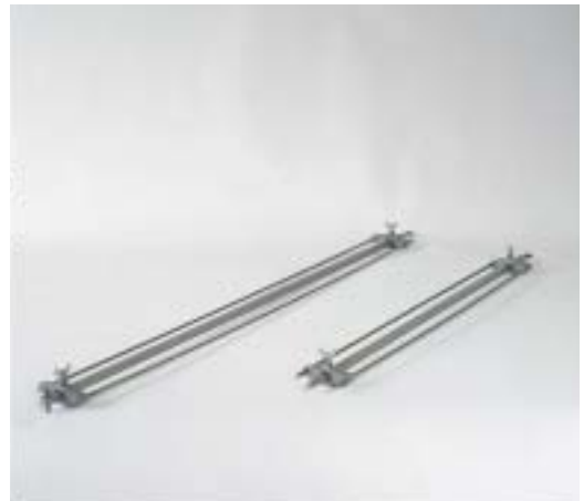
BROCHE SPECIALE LONGUE