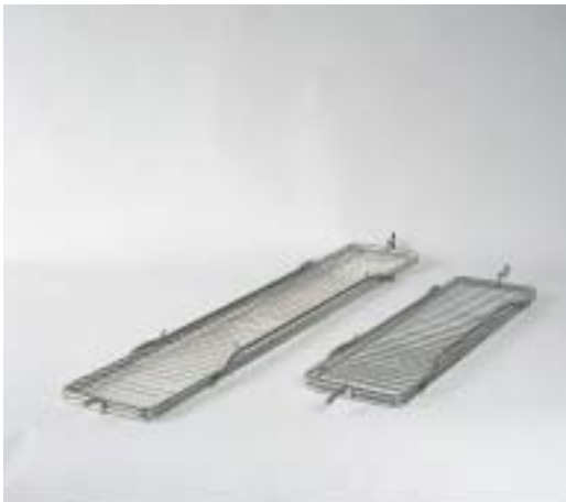
BROCHE POUR PORTION DE POULETS