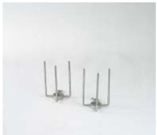
GROSSES FOURCHETTES (spécial porcelet) (seulement pour les modèles planétaires)